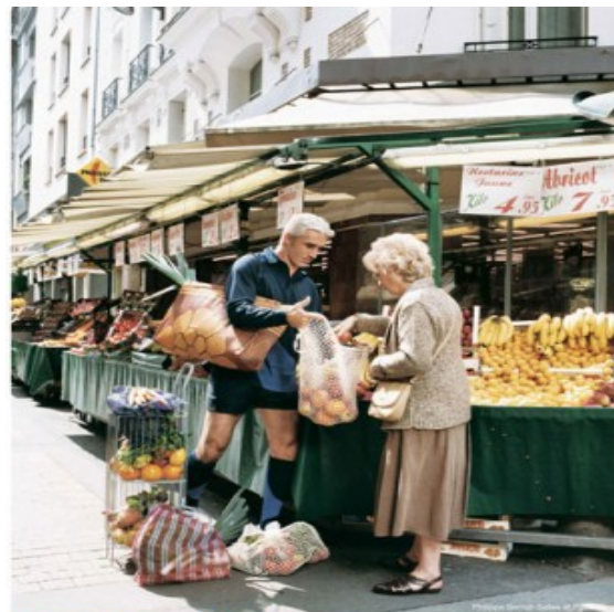
Produits locaux et de saison. Transformez votre essai en bonne habitude !